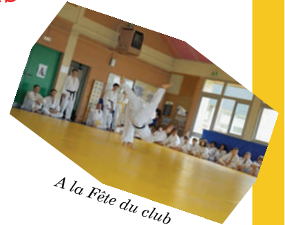
A la Fête du club