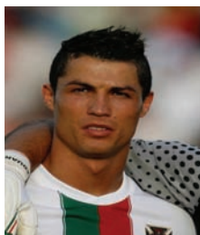
Cristiano Ronaldo ; Portugal

Le second joueur est Cristiano Ronaldo dos Santos Aveiro. Il est né le 5 février 1988 à Funchal au Portugal. Il a 26 ans et pèse 84 kg. Son poste actuel est attaquant. Il a été au Sporting, Manchester United puis au Real Madrid.