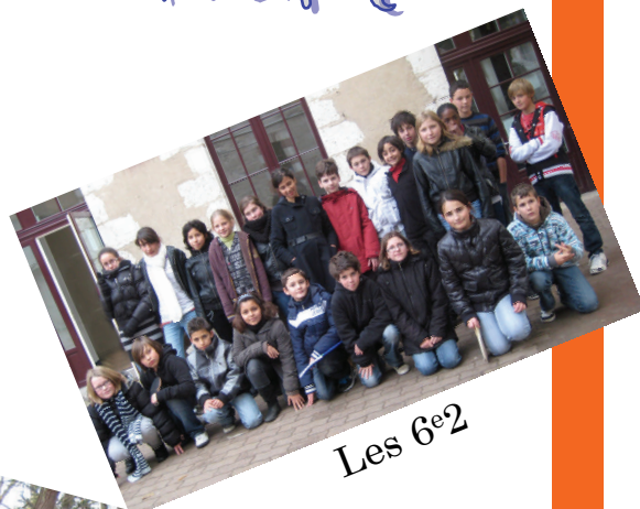
Les 6 e 2