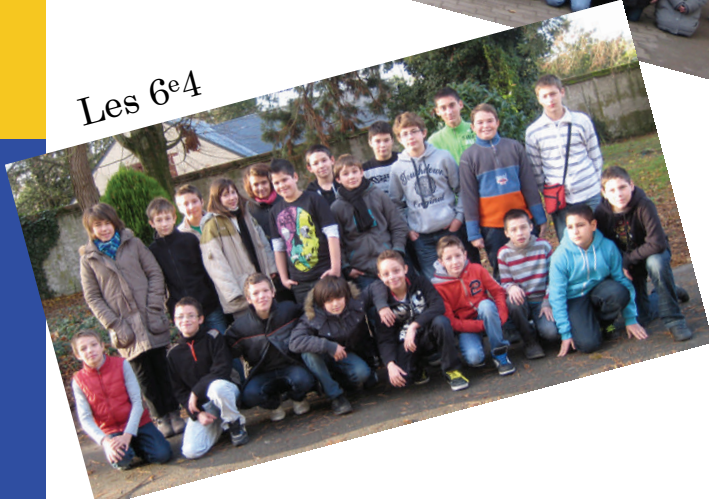
Les 6 e 4