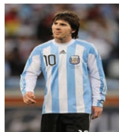
Lionel Messi ; Argentine