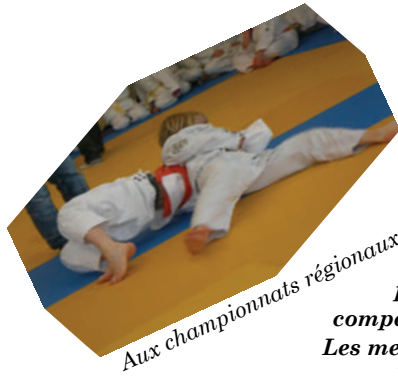
Aux championnats régionaux

Le judo club magdunois a fêté ses 40 ans l'année passée. Ce club a été classé 9 e aux compétitions régionales.